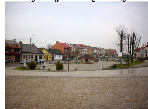
Widelki, 12-13 czerwca 2021 roku